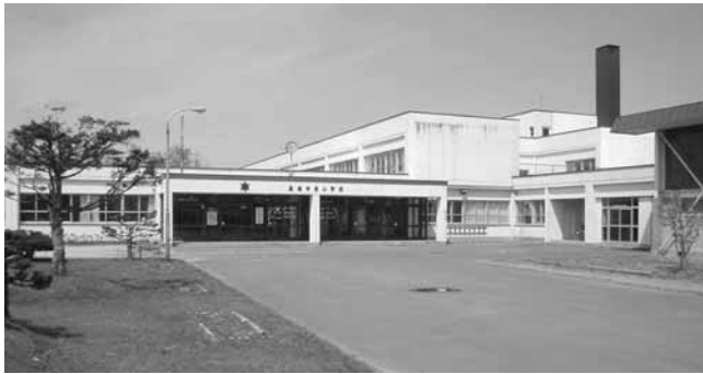
築45年が経過した風連中央小学校

名寄市公共下水道事業認可が平成29年3月で事業の認可期限を迎えたことから、事業期間の延伸及び事業区域や計画人口等について、名寄市総合計画（第2次）等の上位計画との整合性を図りながら見直しを行い、事業計画変更の認可を北海道知事より受けたことに伴い条例の一部を改正するものです。