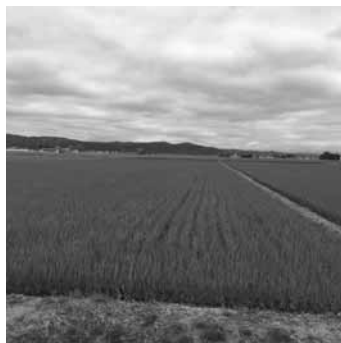
持続可能な農業を目指して