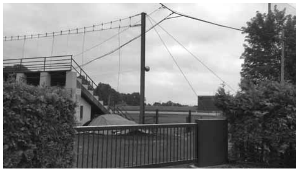
市営球場の再整備を