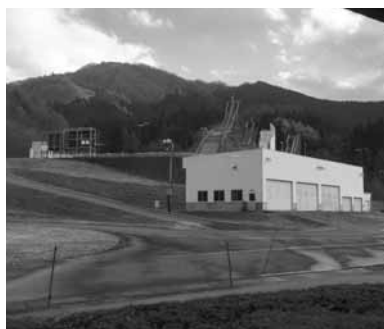
スポーツ振興に取り組む鹿角トレーニングセンター

本市において、今後課題とされている事項について、一つ一つさらに研究し、活性化できるよう、調査研究結果を活用してまいります。