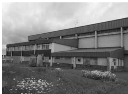
利活用が困難となった名寄地方公設卸売市場

他の質問・地域コミュニティの醸成とまちづくりについて ・名寄大学が実施した、保育者に関するアンケート調査結果について