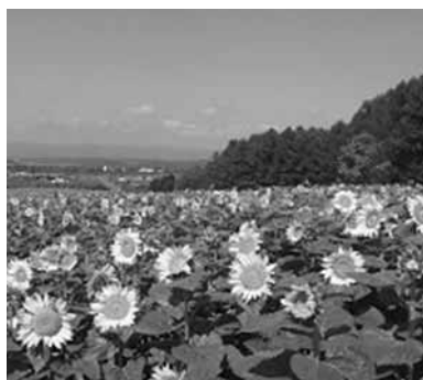
期待されるひまわり観光

答 今年度はひまわりと星を組み合わせた事業を実施する。ひまわりの種の配布数、ボランティア参加者とも前年