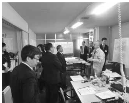
除排雪対策本部を設置し対応。(岩見沢市)

冬期間の除排雪対策本部を設置し、各種申請、苦情の受付、委託事業者や町内会との意見交換の実施、作業の直営部門の充実などによる機動力の強化を図り、雪山・交差点対策や苦情等について迅速に対応する。安全確認、積雪の確認、交差点の状況などを適宜把握するためのパトロールの強化と作業基準の作成により、排雪時期を判断する。機械力の増強はサービス拡大・強化には不可欠であり、年次計画を立てて、計画的に機械を整備し、雪山・交差点排雪、「道路が狭く雪を捨てる場所もなく、車もすれ違