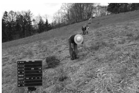
50年後に夢を託しての植樹

他の質問 ・コンパクトシティ実現に向けた取り組みについて・官民一体となった検討の場、設置について。