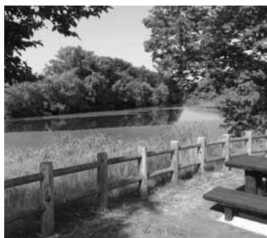
貴重な観光資源の智恵文沼

市立小中学校施設整備計画策定にあたっての基本的な考え方について伺う。 答 老朽・危険校舎の年次的な改築や施設の長寿命化のための改修という視点、多様な教育スタイルに対応できる学校施設整備の在り方、ICTを活用した「次世代の学校づくり」に対応した施設整備、教員住宅の今後の整備の在り方など多方面からの検討を行うと同時に、財政状況を十分に考慮し後年に過大な負担を残さないという視点からの検討も行い、策定作業に取り組んでいく。