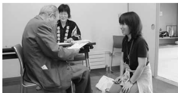
市民の健康意識を高める「なよろ健康まつり」 (写真は昨年の「なよろ健康まつり」の様子)

当委員会では5月29日に委員会を開催し、市民部と健康福祉部及び市立総合病院から第2回定例会提出予定議案の説明ほか関連事業の概要及び経過報告が行われました。市民部からは、平成30年度より国民健康保険の財源運営が現行の市町村単位から都道府県単位に移行されることに伴う国民健康保険税の仮算定の結果と検討課題、今後のスケジュールについて報告が行われ、仮算定確定は9月中旬、