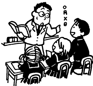
教員の生命・健康を守り、子どもの教育を守るためにも長時間労働の解消を

答 実態調査では88%がアルバイトを経験。トラブルを未然に防ぐための指導を行い、相談窓口を設置し対応している。公立保育所の正規職員は44%。非正規保育士のために労働条件改善を図っている。