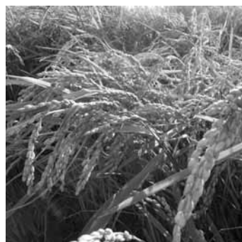
世界一のもち米の街をアピール

問 誕生餅の配布、未就学児の医療費無料化、紙おむつ用ごみ袋の配布、ひまわりらんど、ファミリー・サポート・センター事業等を実施し、妊娠から子育て期の切れ目ない支援を実施しており、独自の祝い金の創設は難しい。