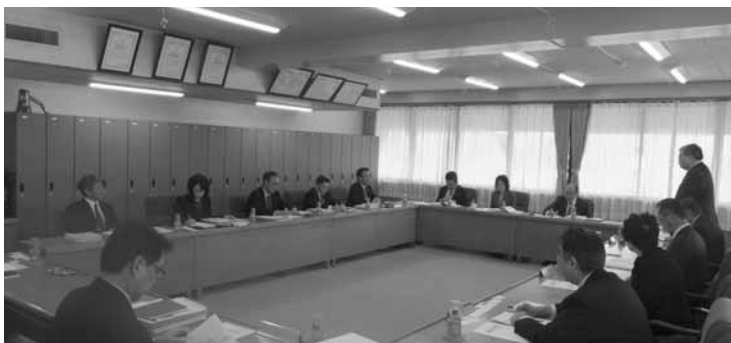
議会改革先進自治体の実践例を学ぶ(栗山町議会)

換のため議会主催による「一般会議」を開催して、議員と町民が自由に意見交換する場を作っています。