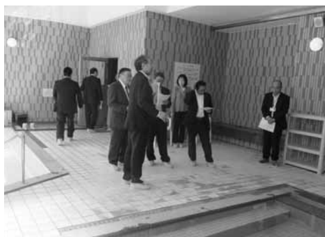
なよろ温泉サンピラーの現状の説明を受ける

平成29年度所管する主な事業について説明を受け質疑を行いました。建設水道部から平成29年度所管する主な事業について説明を受け質疑を行いました。その後、「除排雪について」のまとめを行いました。6月5日は、経済部営業戦略室とともに、なよろ温泉サンピラーの視察を行いました。振興公社職員の説明を受けながら、温浴施設、ホテル、食堂等の現状を確認しました。その後、振興公社職員と営業戦略室、経済建設常任委員会による温泉サンピラーについて意見交換を行いました。