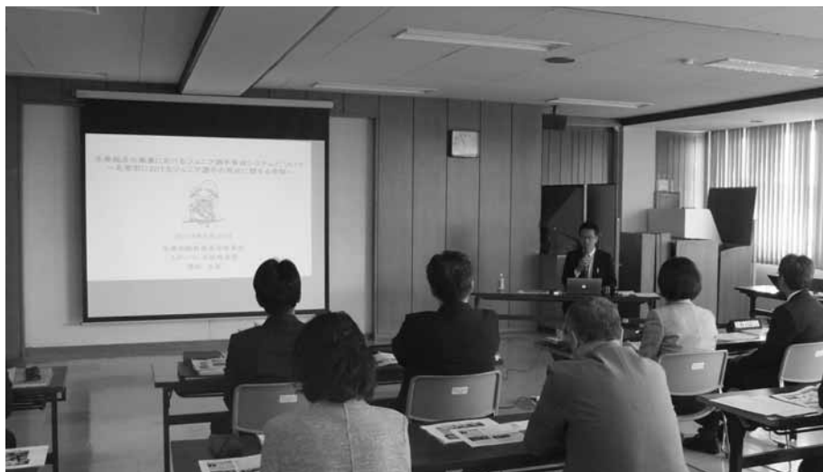
豊田氏から構想を聞く

市立大学からは学生の在籍状況、入学・志願状況、国家試験等の状況について、新棟建設の進捗や新図書館の利用状況、食堂・売店の新設及び運営等について伺いました。