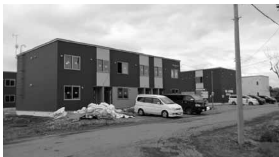
この10年間で1,146戸の民間共同住宅が誕生したが、町内会加入率は5〜20%にとどまっている。

名寄市立総合病院では、特別交付税の伸びがあっても単年度赤字を計上した。今後の安定経営を図るため、一般会計からの繰り入れルールの見直しが必要ではないか。名寄市立大学に設定されている推薦の地域枠による入学を満たしていない状況にあるが、見直しの検討がされるのか。