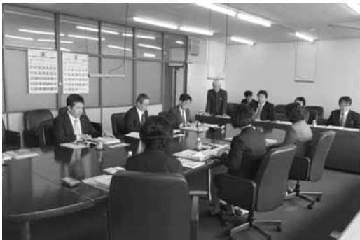
見る議会だよりへ「議会かわら版」の取り組みを学ぶ（留萌市議会）

議会かわら版は委員手作りのA3版片面カラー刷り（ポスター状）を月1回年12回を原則として、市内公共施設など9カ所に掲示しています。読む議会だよりから、見る議会だよりへと取り組みをすすめています。内容は定例議会の案内等が多いようでしたが、市民へのアピール度は大きいものがあると感じ、私たちもぜひ取り組んでみたいとの感想が全委員から出されました。市民の皆さんにより親しんでいただける議会だよりづくりに取り組みを進めたいと思います。