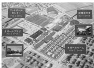
紫波町オガールプロジェクトの全体図(パンフレットより)

岩手県雫石町では「議会広報の編集と発行について」、岩手県陸前高田市では「新図書館の基本構想」、宮城県仙台市では「仙台市天文台の運営」について、それぞれ視察を行い本市において課題とされている事項をはじめ、教育的施設を活用した自治体の活性化策について調査・研究を行いました。