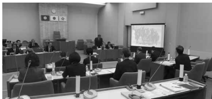
議場にて活発な議会改革の取り組みについて説明を受ける(芽室町議会)

芽室町議会は議会改革度ランキングにおいて、2年連続で全国1位となるなど議会改革の最先端を行く議会です。平成25年より議会開議の主導権確立と委員会活動と議員活動を機動的に行うために通年議会制を導入しています。また、議会活性化計画を策定し、年度毎に評価書としてまとめ