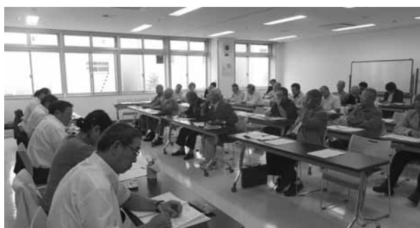
町内会役員と除排雪に関する意見交換会を実施。間口除雪のあり方など多くの意見が出された

まとめにあたり、全委員の共通の認識は、現行の名寄市の除排雪サービスは一定のレベルにはあるが、降雪量が増えることすべての対応に影響が出るというギリギリのところにあるという認識で、これまでの市民の皆さんの除排雪に対する不満や不安を解消する