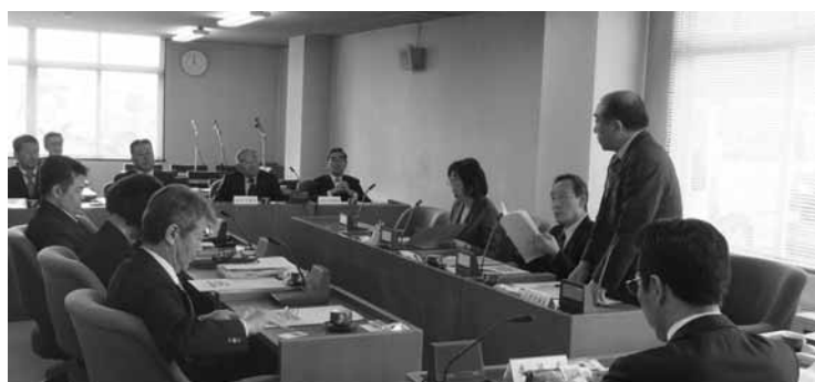
2 常任委員会での議会運営を学ぶ(紋別市議会)

紋別市議会は、平成26年7月の選挙より議員定数を18名から16名へ削減、それに伴い