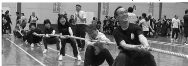
気力を振り絞って、力を合わせて綱を引く

今年で24回目を迎えたチャレンジデー綱引き大会は、昨年より17チーム多い157チーム(小学生69チーム、一般88チーム)が参加し、スポーツセンター内は、選手皆さんの熱気溢れる中で開催されました。議員チームは一回戦不戦勝で勝ち上がり、その間、他の試合を観戦しながら、二回戦に臨みました。二回戦の対戦相手は高校生で、一本目は一気に持つて行かれました。二本目は選手の交代を行い、何とか同点となり、三本目は若さに負け、敗退しました。が、楽しく良い汗を流しました。