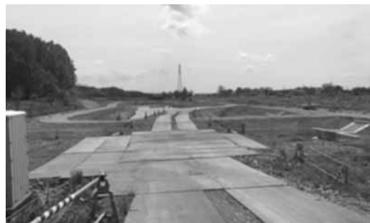
豪雨による冠水被害の低減が期待され完成が待たれる豊栄川・17線遊水地

他の質問 ・路面清掃について ・見通し不良道路の改善・弥生共同墓地の転回広場の拡幅