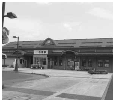
JR宗谷本線の存続を

答 国や道、JRとの協議と活性化推進協議会について。鉄道ネットワークワーキングチームからの答申を踏まえて存続に向けた協議を深めている。今後は地域としてできることも研究する。