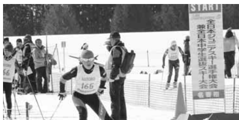
今年3月選手約440名の参加を得たJOCジュニアオリンピック大会