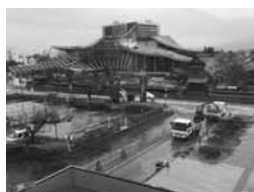
合併特別債を活用し平成29年8月末完成予定の「鶴岡市 新文化会館」