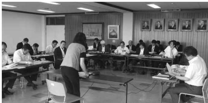
案件の説明を受け、慎重な質疑が行われた議員協議会

不明に対する経過報告があり、その後、地方創生関連交付金（加速化・推進）効果検証について、公の施設に関する使用料の設定基準（案）について説明がありました。公の施設使用料については、減免措置、利用者区分の統一、時間帯などの基準や冷暖房料金設定の考え方などの説明があり、平成30年4月1日実施にむけ、第3回定例会に提案したいとの説明がありました。