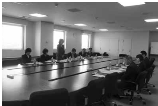
特色ある紙面づくりについて説明を受ける（石狩市議会）

二日目は留萌市議会で、「議会かわら版」発行などについて視察・研修を行いました。広報常任委員会の委員8名が、議会広報作業班4名、お知らせ掲示板（かわら版）作業班4名に分かれて活動。議会広報は年4回、費用節減を目的に平成16年5月より市の広報誌の中に組み込んで発行されています。また、市民に親しまれる議会だよりとするために公募によりネーミングを、議会です。こんにちは「