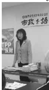
議会報告をおこなう