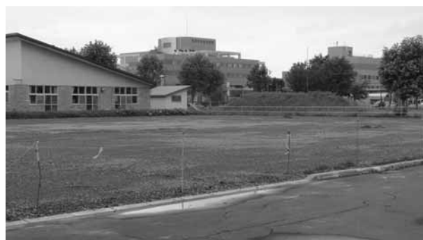
来院者の駐車場問題解決に向け整備が進められる

ジュールでは、5月16日に保健医療・高齢者合同部会を開催し、計画に盛り込む必須事項の確認とアンケート実施後、分析し、素案を作成する報告を受けた。市立総合病院からは、平成28年度病院事業会計の補正予算で65件224万円の債権放棄等の理由、全体の決算概要、平成29年度の診療体制、平成30年からの地方公営企業法の全部適用に向けた今後の行程のほか、新たに165台分の駐車スペースを確保するため院内保育所及び開発建設跡地に駐車場整備すると報告説明が行われました。