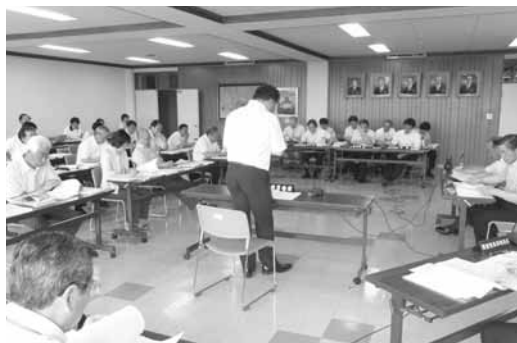
慎重な質疑が行われた議員協議会