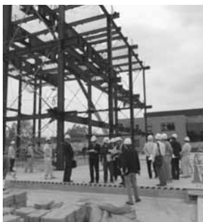
計画通り工事が進む 仮称・市民ホール

委員会は5月21日に開催しました。前半に（仮称）市民ホールと文化センター小ホール工事現場を視察し、工事と運営計画の進捗状況について説明を受けました。後半に各所轄部署から平成26年度の主な事業として教育委員会から学校教育課、指導主事、生涯学習課、名寄市公民館、智恵文公民館、風連公民館、児童センター青少年センター、教育相談センター、北国博物館、図書館、天文台、学校給食センターについて説明を受けました。総務部からは企画課、総務課、行革・職員・研修担当、防災・法制・訟務担当、情報システム担当、財政課から説明を受け、次に名寄市立大学並びに短期大学部から説明を受けて審議しました。