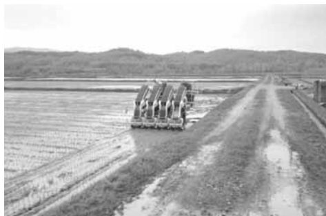
国の農業改革 農業、農地を守るとは？

答 農業委員会は公選制のもと農業者の代表として、地域の信任を得て農地の権利調整に関与し、農地を守る視点から課題の解決を進めてきた。今後とも上部団体等と連携しながら農業者と農業を守る視点に立った取り組みを進める。 他の質問 ・災害時援護体制について