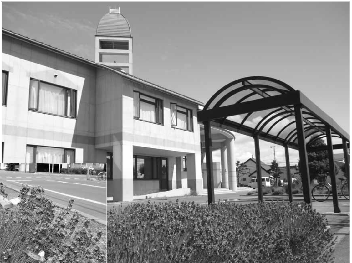
夏の訪れを彩るラベンダーが咲き誇り、登下校の児童や市民を香りとともに和ませてくれます。(東小学校校庭)