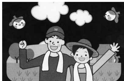
地域の元気は農業の元気から

問 当市の知名度向上、地域おこしの一環として「なよろ煮込みジンギスカン」を「当地グルメと位置付けた取組み」がなされているが、より一層