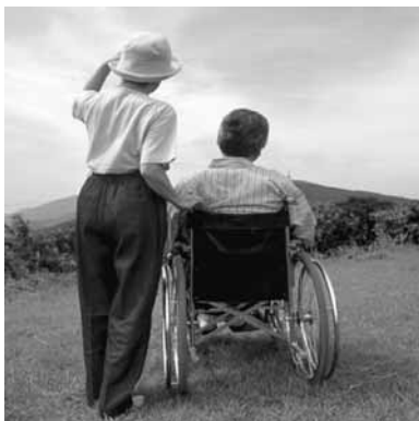
求められる高齢者支援