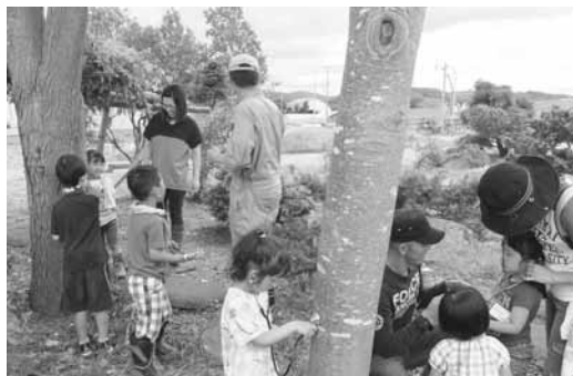
子どもの未来のために