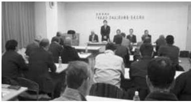
11月に開催した 市政報告・意見交換会

平成25年度は5月と11月に市政報告・意見交換会を開催し、5月には「よろーな」駐車場用地買い戻し、「仮称市民ホール」について、また11月には市内4カ所で会派の活動について報告し、市民のみなさんと意見交換会を行いました。10月には名寄市政への反映を目的に、京都府長岡京市で「市民協働マニュアル」、三重県松阪市で「市民病院の取り組み」、亀山市で「市民生活応援制度」、愛知県岡崎市で「地産地消・食の安心安全の取り組み」、静岡県掛川市で「新ごみ減量化大作戦」について調査研修。また、会派としての条例提案に向けて「男女共同参画推進」公約「条例」について調査・研究を行いました。