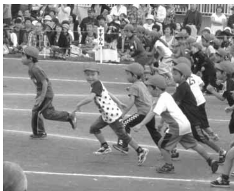
若者や子どもたちにもっと支援を！