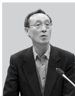
市民連合・凜風会