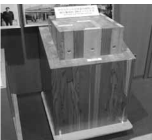
耐火集成材「燃エンウッド」

平成26年2月5日から7日の3日間、横浜と東京都内で政務活動費を活用し2カ所の視察及び1セミナーに参加しました。2月5日の横浜の新聞博物館では、新聞の歴史的役割を再確認するとともに、新聞の取材、編集、製作等を学び今後の議会だよりの編集にしっかりと生かしていきたいと思えます。2月6日の横浜郊外の耐火木造大規模商業施設「サウスウッド」では力ラ松耐火集成材（燃エンウッド）を利用した新しい環境に優しい、まちづくりを勉強できました。2月7日の東京紀尾井フォーラムにて、信頼される議会と題した2014地方議員フォーラムに参加し、住民参加の促進と政策提言の重要性を再認識できました。