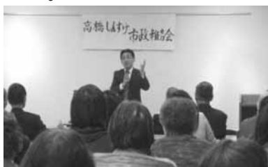
市政報告会の様子

3月17日ふっれん地域交流センターで市政報告会を行い、33名の参加者に一般質問の要旨・名寄市の現在の状況・文化センター建設・名寄市立病院精神科棟・軽減税率の重要性を説明。冬期の事故対策と国民健康保険・介護保険について質問を受けました。