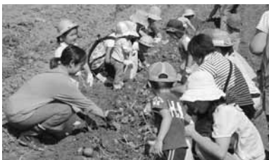
親子お出かけバスツアーでイモほり体験

委員会は、5月20日に開催し、主に市立病院関連では、平成25年決算見込及び診療実績の報告があり、約3億1千万の純損失。旧精神病棟解体工事、駐車場工事、ヘリポート訓練・運用のスケジュール等の報告がありました。市民部関連では、平成25年度市税収納率99.42%で全道1位の報告等がありました。健康福祉部関連では、臨時福祉給付金・子育て世帯臨時給付金事業、遠距離通園・通所助成事業（3以上の通園通所補助）養育医療給付事業（未熟児対象）、地域活動事業（親子お出かけバスツアー）、こども発達支援事業その他5件の事業報告と生きがいホビーセンター条例の廃止と生きがい講座の実施要領（案）の説明がされました。