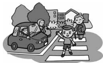
安全なまちづくり!!

経済部 企業立地促進条例の一部改正 木質バイオマス利活用調査報告 平成26年度農林業施策 平成26年度商工労働観光交流施策の概要説明及び4月4日の大雪による農業被害と豚流行性下痢（PED）の発生状況説明。討議項目は、6丁目歩道の老朽化問題、防塵舗装の一定規格の必要性、除排雪で見通しの悪い箇所・児童生徒の通学路の安全対策問題、農業青年アドバイザーの活用法と計画内容、経営所得安定対策で振興作物のJAとの差異について。