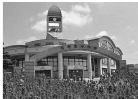
学童保育の整備が待たれる東小学校

答 新たに名寄市・風連地区及び全国戦没者追悼式の黙とうに合わせて1分間のサイレン吹鳴を実施。日本非核宣言自治体協議会への加盟は活動内容などを調査し判断。市長の表明は広報やホームページを活用して実施を検討する。 他の質問 ・風連地域の振興と庁舎のあり方について