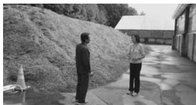
南富良野町自然エネルギー活用用のピンチップ乾燥施設にて

10月10日には、上川・留萌管内女性議員研修会に参加し、男女共同参画事業にかかわって近隣市町村の例から研鑽を深めました。