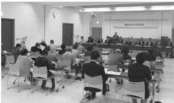
市民説明会（よろーな会場にて）

ころ、市民の意見は議会、議員の活動が見えないのが問題であり、市民の負託にしっかりとこたえることが重要とのご意見でありました。最終判断は議長に任せられ、結論は議会基本条例第17条を根拠として18名とすることで理解をしていただき、本議会で議決いたしました。市民に見える議会活動をめざして、さらなる改革を委員会にお願をしたところとです。定数削減が市民の不利にならないように精進してまいりますので、市民の皆様にはご理解をお願いいたします。