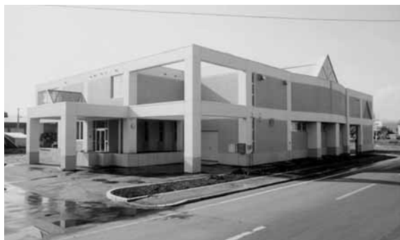
公会計化の一元化が望まれる給食センター

答 当初の計画よりも遅れたが基本構想案がまとまった。今年度は、市民の意見を聞く機会を設け、老朽施設の改修・更新や新たなニーズに応じた新規施設の整備などハード、ソフト両面の魅力を取りまとめ構想案を策定していく。