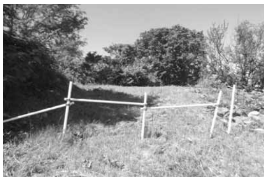
不法投棄や害虫発生が地域で問題となっている

答 1カ月の試験的な運用期間が必要のため、開始は8月1日となる。留学生などについて条件整備を検討する時期と考え、今後協議する。