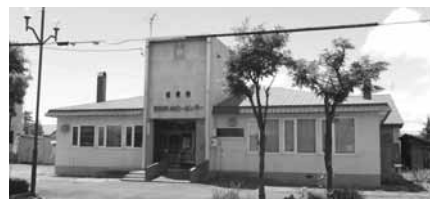
生きがいホビーセンター