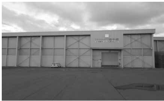
雪室型もち米低温貯蔵施設

答 後期計画は、TPPの対応や農業者の高齢化、担い手不足が課題となつており、JA生産部会や青年部、女性部等から幅広く意見をいただき