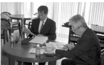
担当者の説明に聞き入る

新緑風会の平成25年度政務活動は、本年1月に九州2県3市で視察研修。鹿児島県南九州市では「安心・安全な食の生産供給体制」を、同県指宿市では「PFI方式による道の駅整備事業」を、長崎県長崎市では「特別支援事業」を、それぞれの取り組み状況を学ぶことができました。中でも、長崎市では「障がいをもつ個性として持つ子どもが、年齢と共に成長、発達していくか。そのすべてにわたり、本人の主体性を尊重しつつ、できる援助の形を常に模索しています」と、障がい児支援に注ぐ同市の姿勢がうかがえました。また、農薬散布時に黄色い旗を掲げて飛散防止に努め、安全安心な食の生産供給をブランド化した南九州市の取り組みからも多くを学びました。