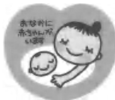
これが「マタニティマーク」