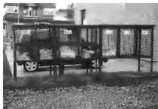
ゴミ減量化は、事業所・個人の高揚が必要。分別が徹底されているゴミステーション