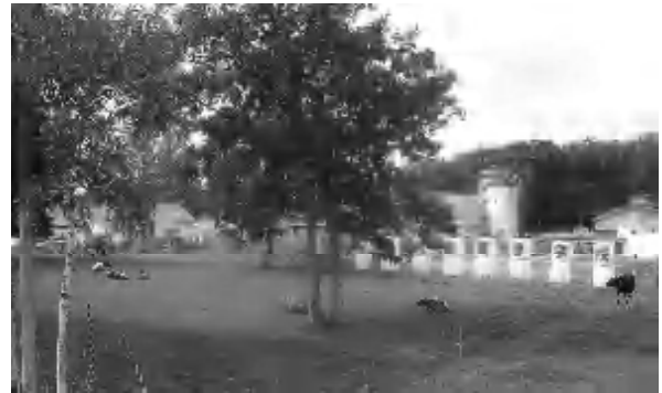
名寄農業高校の充実した施設

答 これまでの農業や地域貢献度を評価し、新設校の中で、担い手育成の拠点となるよう道教委に働きかけを続けたい。