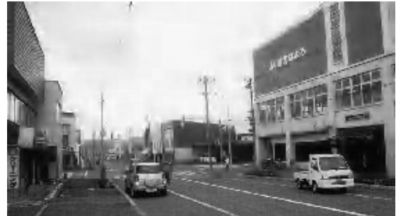
再開発事業が待たれる風連本町地区

答 実質赤字比率など4項目の健全化判断比率を議会に公表することが義務化されるとともに、一定の率によって早期健全化団体、再生団体となる。現状では危険ラインを超えることはない。しかし、今後とも中期財政計画に基づきながら、住民サービスの低下を招かないように努力する。