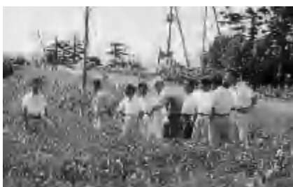
市内の作柄概況調査(8月30日)