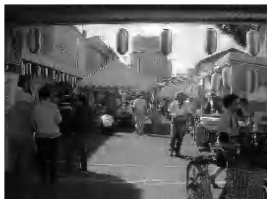
多くの市民で賑わった 第25回もみじまつり(9月2日)

他の質問・教頭の本業に専念できる現場の実態について・AEDの保有状況と知識普及について・消防団の充実について