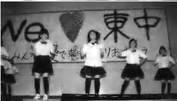
(上) さくらんぼ・ちゅうりっぷ合同で行われている 地域子育て支援センターでの1コマ