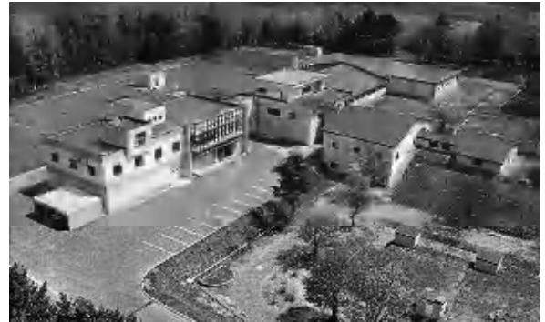
安全な水を守る緑丘の浄水場