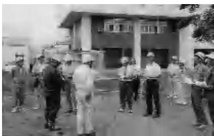
下水終末処理場で滞水池建設の説明を受ける(7月20日)

2回目は、諸課題について理解を深めた後、北7丁目道路、緑丘第2団地通線、道の駅、南団地建替え予定地などを視察した。