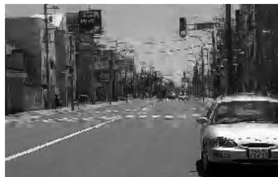
人を招きいれるまちづくりが進められる名寄市街地

答 生きた条例が不可欠。市民が如何に自治体運営に参画できるかをルール化し、市民主権のまちづくりが進められる規定としたい。 他の質問・公益通報者保護法の運用について・独居の閉じこもり市民に対する救援、救済について・中心市街地活性化基本計画策定について