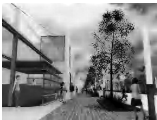
風連地区市街地再開発事業のイメージ図