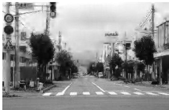
市民参画と意識改革で中心市街地活性化を

答 旭川医大からの派遣は1年限りであり、来年度も体制維持のための要請を続ける一方、安定的医師確保に努めたい。予約制、請求行為も不備のないよう対応する。大学も今後とも地域とともに歩む大学を目指していく。