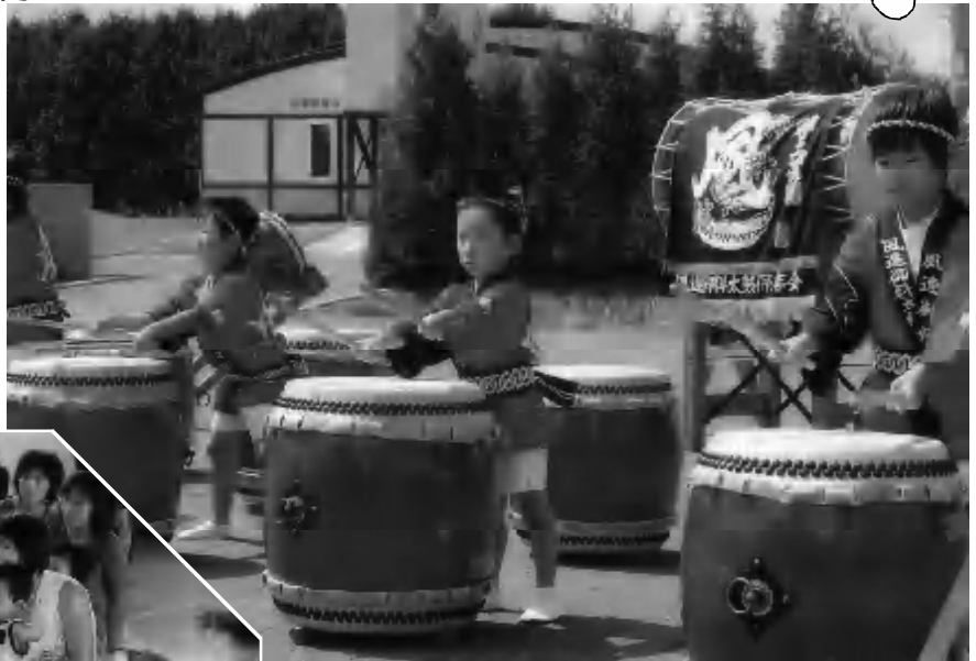
風連日進100年記念式典アトラクションで 真剣に太鼓をたたく子供たち