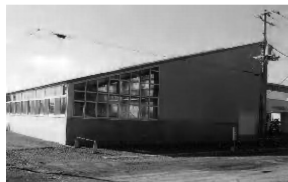
5月19日にオープンした市営南水泳プール

答 オープンから8月末までの利用者は1万4,980人。開設後、シャワー室や更衣室に水が溜まるなどの不具合があり、応急措置を行っているが、施設閉鎖後に全体点検を実施し、手直しを含めて対応したい。駐輪場は、事故の懸念がないよう施設東側に確保する。また、道路改修は、豊栄川にかかる人道橋の改修工事後に行いたい。