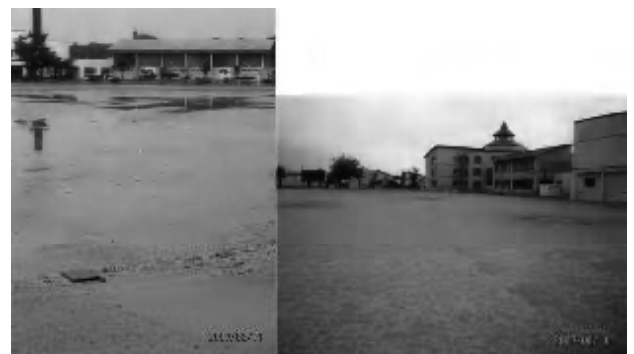
(左) 水はけの悪い風連中央小学校 (右) 水はけの良い名寄西小学校(8月11日同日撮影)