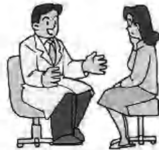
市民負担の軽減を