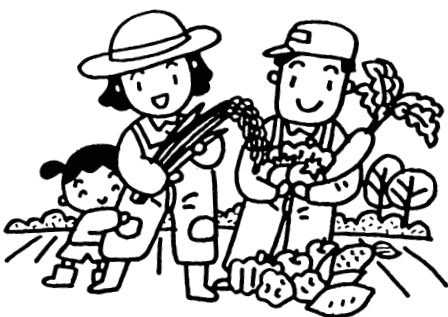
厳しい農家経営に支援を

地域の求める諸課題にかかわり、大学の機能を発揮して安心、安全のまちづくりなどに市民と交流を図りながら進める。