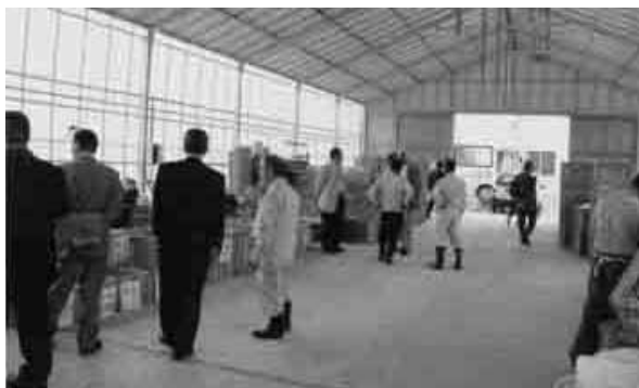
風連地区リサイクルセンターを視察

名寄市風連一般廃棄物最終処分場、リサイクルプラザの五施設で行い、それぞれ各担当職員から説明を受け、風連一般廃棄物最終処分場の現況に對して、各委員からは容量、面積について今後の課題になるとの厳しい見通しを示す意見も出た。