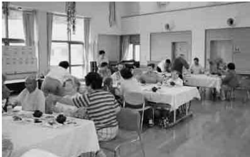
予防に重点を置いたサービスの提供を（清峰園）

事の認可を受けることになり、多方面からの検討を加え慎重に判断したい。 問 定住対策事業は本年度末をもって終了となるが、継続も含めて再構築を図るべきでないか。 答 制度終了後見直しをした。特例区協議会等の意見を聞いた中で、判断をしたい。 高校教育の指針について 問 統廃合の対象になっている風連高校については、光凌、名寄農業高校のキャンパス型高校の枠組みの中に入れての対策を早急に講ずるべきでないか。 答 普通高校のキャンパス型か検討対象になり得るかどうかが研究したい。今後のあり方については多くの市民、学校など関係者の意見を広く聴き誤りのない判断をしたい。 児童生徒の安全対策は 問 危機管理の見直しと子供を一人にさせない対策を急げ。 答 安心会議の機能強化と、地域全体で守ることを基本に、保護者、地域が一体となった対策をしっかりと講じていく。