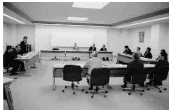
名寄市立大学で説明を受けた

計画について説明を受けた。総務部では、合併後の組織機構、新市の過疎地域自立化計画の策定、総合計画策定審議条例案、自治基本条例や自治区の取組み、新行財政改革推進計画の策定、国民保護計画の策定、合併記念式典の挙行等の日程や考え方について説明を受けた。