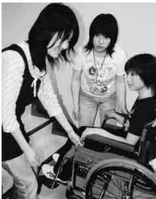
あつたかい市政の実現を

答 平成十八年度は二十二億円を予定しているが、総合計画の中に計画的事業を示していきたい。