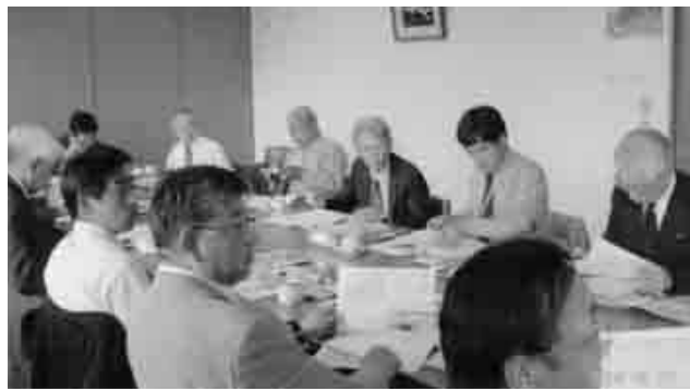
砂川市で再開発の経過説明を受ける

では、土木Aランク(十社)、Bランク(八社)、Cランク(九社)、建築Aランク(五社)、Bランク(八社)、Cランク(七社)になったとの報告を受け、委員からは、入札に関して市内業者を優先することなど、多くの意見が出された。