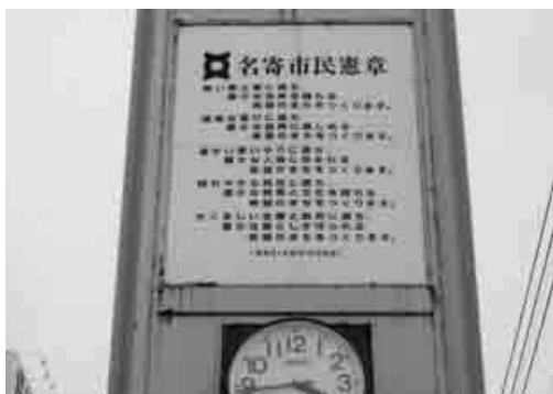
掲示されていた旧名寄市民憲章

問 ※ ポジティブリスト制度は、農業経営者のみならず、消費者も関心の高い制度である。対象農薬が約三倍になり、加工業者も対象になるが、今後の対策は。また、農薬散布機