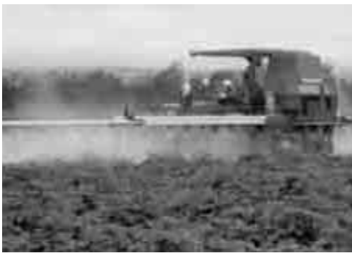
ポジティブリスト制度で、より安心安全の対応が求められる

問 耕作面積の拡大により法人化に向けての総合的な知識と指導が必要だが、職員教育をどうするのか。又、農業人口減少に歯止めをかけるためにも、新規就業要件の配偶者か同居親族が必要との条件は、ハードルが高いのでは。