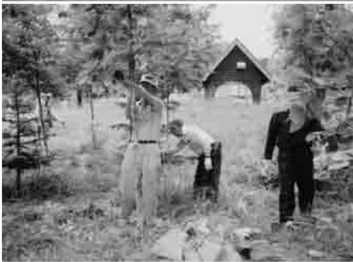
森林・林業・林産業活性化推進名寄市議会議員連盟（通称林活議連）では、平成6年から健康の森にサクラを植樹し、毎年サクラを増やしたり、草刈り、枝払いなどを実施しています。今年も7月6日に手入れをしました