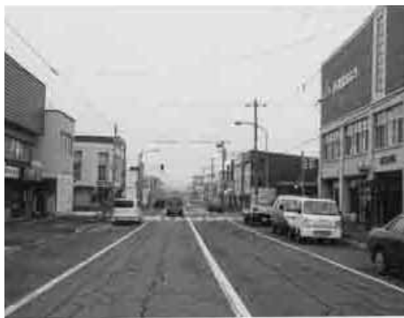
再開発が待たれる風連市街地（本町）

答 新市として、教育委員会が新たに発足したところだが、学校建設委員会の答申書に基づき、小・中校等の一貫校と名寄高校を除く三高等学校を職業・福祉の両面から検討し、教育委員会として市民の声を聞き検討する。