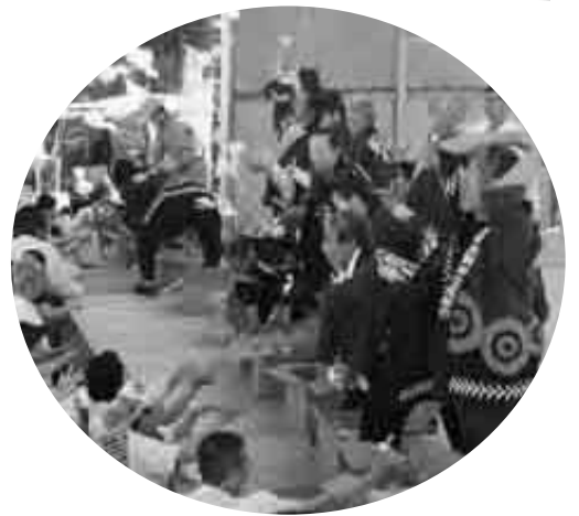
名寄市議会議員会として初めて「ふうれん白樺まつり」に参加しました（もちまき）