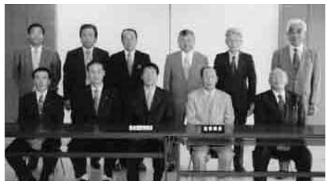
議会運営委員会の委員

寄市総合計画策定審議会条例の制定について、平成十八年度名寄市一般会計予算など、十六件の議案、株式会社名寄振興公社の経営状況についてなど八件の報告について協議した。さらに代表質問、一般質問の順番について、予算委員会の会議の進め方について、また正副委員長の互選についてなどを議題とし、協議した。 六月二十日は追加議案について、名寄市特別職の職員との給与に関する条例の一部改正、名寄市農業委員会の推薦など、六件の議案について協議した。