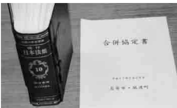
法に基づき厳正な対応が求められる

答 食育に力点をおきたい。学校給食費の未納について早急に解決し、地場産品の利用や雇用問題についても、必要な協議と説明責任を、これからも果たしたい。