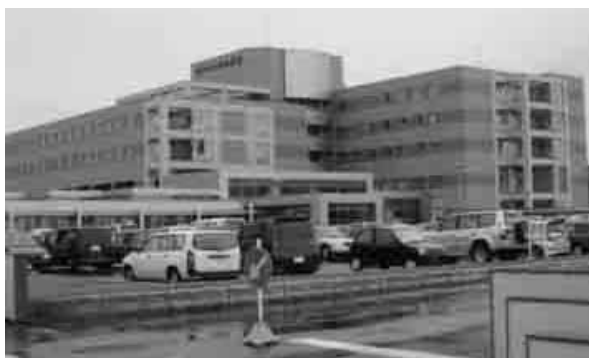
充実した医療なくして地域の住み良さは語れない

答 近年、地方公営企業法の全部適用病院は増加傾向にある、経営の効率化、機動性、柔軟性が求められる中で選択肢の一つと考える。医事業務の委託については五回検討会を開催し、一部委託を十九年度から実施するため、業務の洗い出しを行っている。全部委託から経費面でのメリットが出るが、委託職員の地元での確保の困難さなどの課題もある。