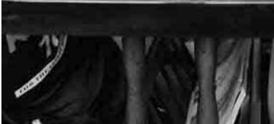
ヒナから育てたスズメと遊ぶ 東風連小学校児童