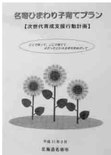
平成17年3月に策定された旧名寄市の子育てプラン