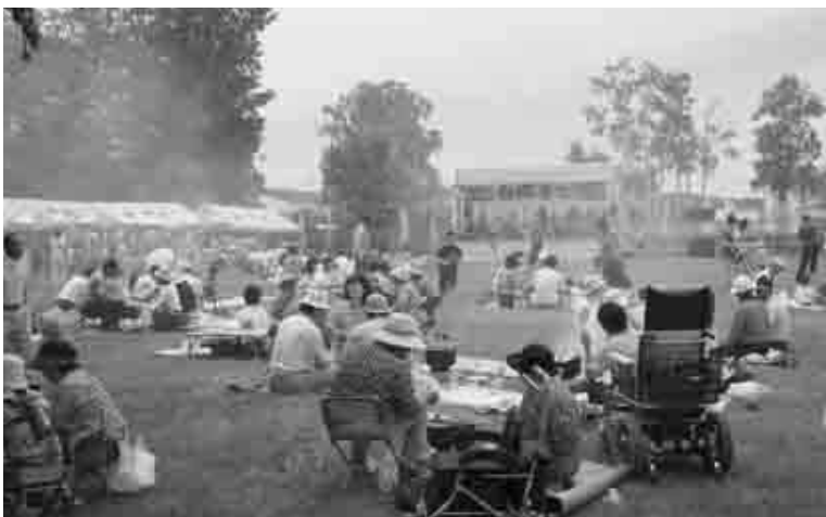
多くの市民で賑わった第27回ふうれん白樺まつり

答 合併協議でも色々と議論され、また風連町学校校舎建設等検討委員会からの各種答申の中では平成十八年度基本設計からの提言である。しかし国の「安心・安全な学校づくり交付金」制度の創設により、改築年次がずれるが、新市総合計画に盛り込むよう努めたい。