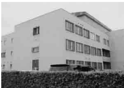
閉鎖が懸念される精神科病棟