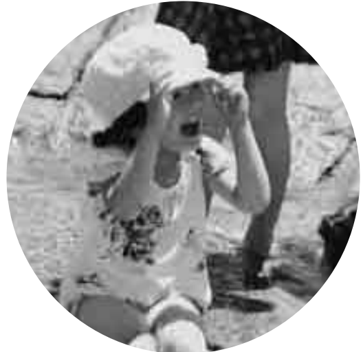
7月2日のふれあい広場で