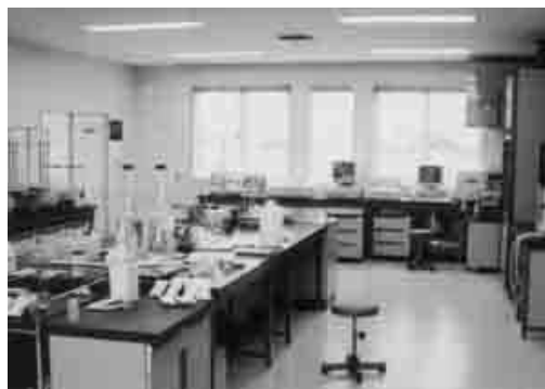
農業振興センターの中核施設である土壌分析室

問 クリーン農業は、新名寄市農業の振興の柱である。そこで生産された農産物を地産地消を含め、どのように販路拡大を図るか。