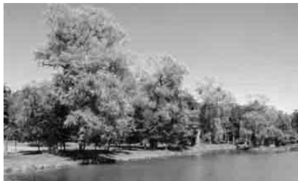
市民のやすらぎの場 名寄公園

問 高齢者に優しいまちづくり支援として、新しい公共交通システムが求められるようになってくると考える。今注目されている『デマンド交通システム』は、自治体の経費