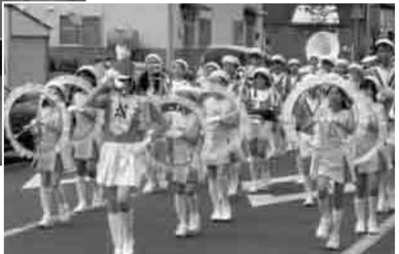
平和音楽大行進で見事な演奏を披露する名寄小学校