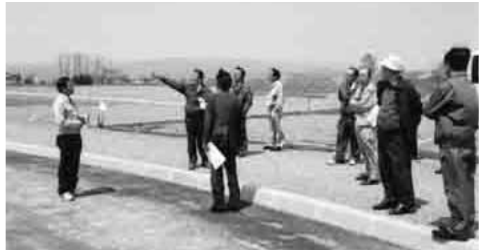
「道の駅」建設地を視察

担当課長の出席を求め、①道の駅事業について②ピヤシリースキー場施設整備について③なよろ温泉サンピラー施設使用料についての説明に対して、道の駅の採算性や運営検討会議での協議の進捗状況を確認した。また、サンピラーへの助成内容の変更に對して手数料等の確保のための経営努力を求めた。