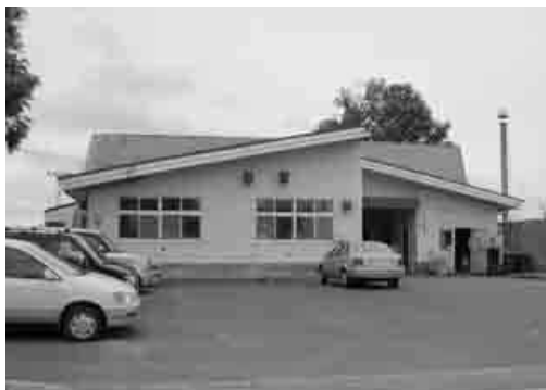
築32年が経過した風連給食センター

問 統合後、風連九名の職員の雇用は。また、風連地区のPTA・教職員との協議、さらに統合後の風連学校給食センターの利用はどうなるのか。 答 職員構成は、名寄は三十