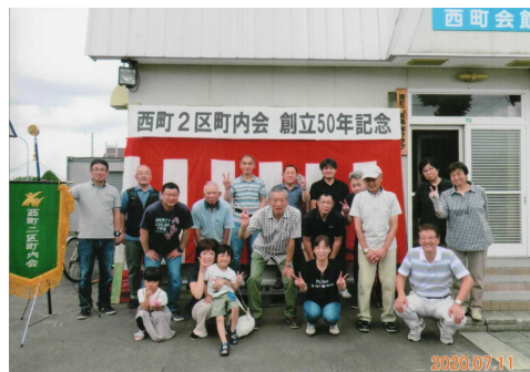
← 実行委員会にて記念撮影