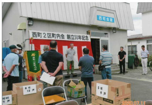
← 記念品配布前の1コマ

予定していた記念式典は新型コロナウイルス感染症拡大に伴い中止となりましたが、7月に今までの歩みと未来への希望を記したDVDと記念誌を発行し、記念品とともに町内会全世帯に配布しました。