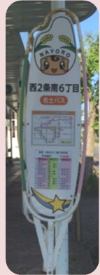
コミュニティバス バス停