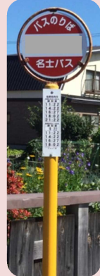
日進ピヤシリ線 風連線 バス停