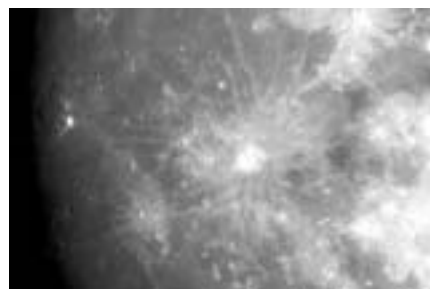
屋上観測室内50cm望遠鏡にて 2月26日撮影

月のクレーターにはそれぞれ名前が付いています。写真中央にあるのが「コペルニクス」という名前が付いたクレーターです。このクレーターは、地動説を唱えた天文学者ニコラウス・コペルニクスから付けられました。