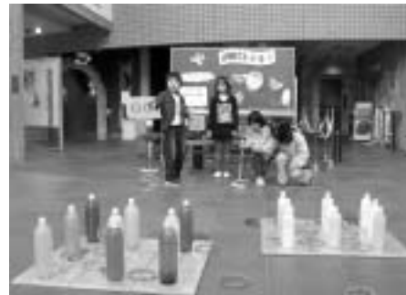
昨年の「博物館であ・そ・ぼ・う!!」