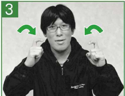
「あいさつ」という手話

やり方…向かい合わせた人差し指を会釈させるように折り曲げます。 (お辞儀をし合うようすです)