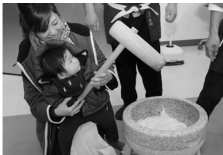
お母さんと一緒にもちつき♪