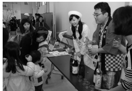
名寄産もち米を使った日本酒・本みりん・甘酒の試飲も行われました。