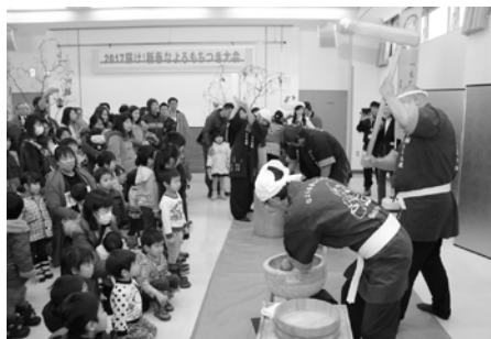
なよろもち大使によるもちつき実演。みんな目が釘付け！

1月14日(土)に駅前交流プラザよーなで「新春なよろもちつき大会」を開催しました。このもちつき大会は、市民の皆さんと一緒に新年を祝うために企画したものです。もちつきのほか、つきたてのおもちを使ったお雑煮の無料提供が行われるなど、会場は大いに賑わいました。