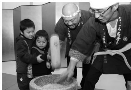
二人で仲良くもちつき！