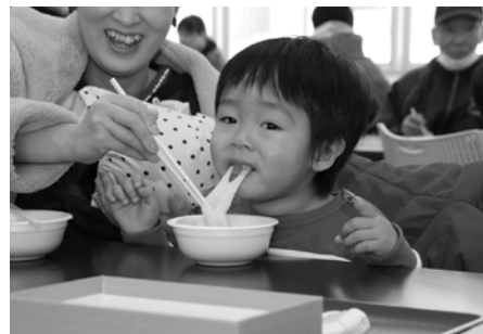
つきたてのおもちはおいしい～