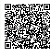
名寄市ホームページの総合計画ページ