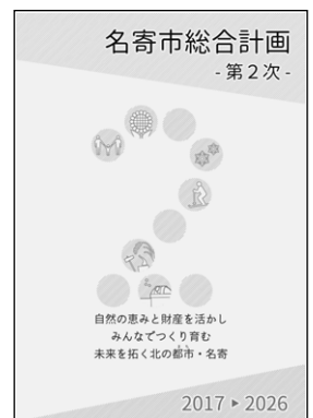
名寄市総合計画冊子

市民の皆さんには、ぜひ一読されて、名寄市の未来をいっしょに考えてもらいたいと思います。