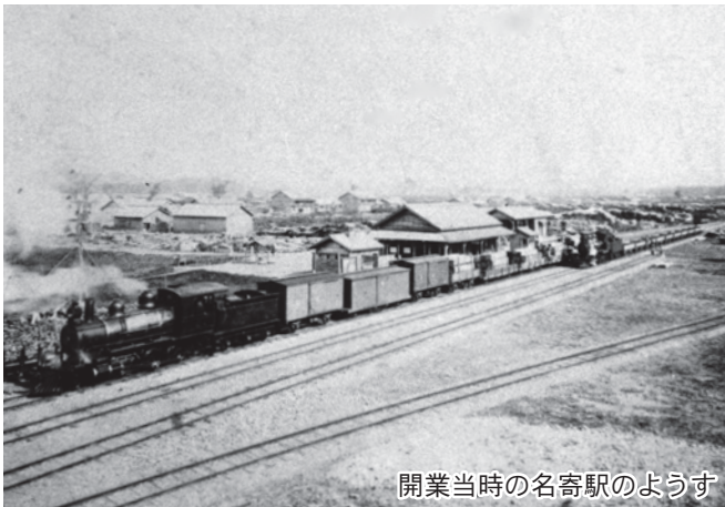
開業当時の名寄駅の様子

その後、路線の編入・分離・改称を行い、1930年（昭和5年）に現在の宗谷本線となりました。