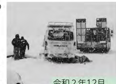
令和2年12月 風連地区での事故