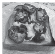
サバ缶のピザトースト

藻類から摂取し、血糖値の上昇を抑えましょう。サンマ、アジ、イワシ、サバなどの青魚には、オメガ3脂肪酸のDHAやEPAが多く含まれています。DHAは脳の構成成分であり、記憶力や判断力の向上、認知症予防、特にアルツハイマー型認知症の予防に有効です。