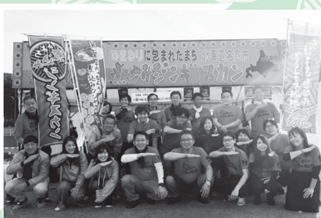
令和元年に兵庫県明石市で開催された「B-1グランプリ」での集合写真