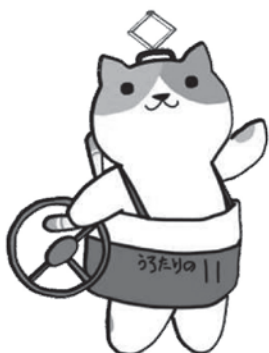
公共交通利用促進キャラクターのりたろう

新型コロナウイルス感染症が収束した際には、バスや鉄道を乗り継いで遠くの街まで足をのびしてみたいかがでしょう。