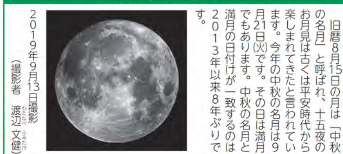
2019年9月13日撮影

旧暦8月15日の月は「中秋の名月」と呼ばれ、十五夜のお月見は古くは平安時代から楽しまれてきたと言われています。今年中秋の名月は9月21日(火)です。その日は満月でもあります。中秋の名月と満月の日付けが一致するのは2013年以来8年ぶりです。