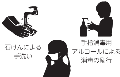
石けんによる 手洗い