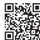
▲市ホームページはこちら

予約開始時期については、広報なよろ、市ホームページ、名寄市公式LINEなどでお知らせします。なお、職域接種および北海道ワクチン接種センターなど市外で3回目接種を希望される方（2回目接種終了後6カ月を経過している18歳以上）については、保健センターまでご連絡ください。