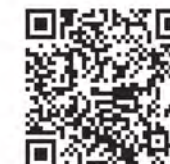
▲名寄市公式LINE友だち登録はこちら