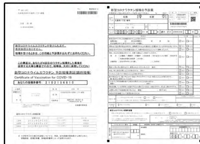
▲接種券一体型予診票

接種に必要な4回目接種券の様式が、シール型から「接種券一体型予診票」に変更になります。