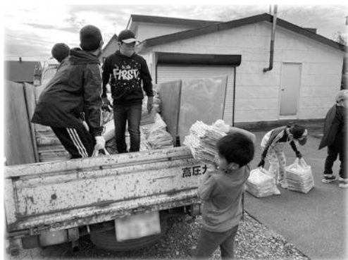
▲子ども会による廃品回収のようす

廃品回収は、資源物のリサイクル率の向上につながります。廃品回収を実施していない町内会や団体においても、ぜひ取り組んでいただき、その後は奨励金の交付申請をお願いいたします。