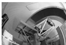
▲ピリカ望遠鏡 (北海道大学所有)