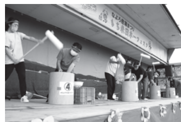
▲昨年のもちつきチャンピオン決定戦の様子

もち米生産日本一のまちのもちつき名人を決めるイベントです。 2人ペアの4組でいっせいにもちをついて、制限時間で優勝を競います。 ※審査基準は大きく分けて「もちのおいしさ」と「もちのつきっぷり」 の2点。なめらかでコシのあるもちを元気よくつきあげましょう。 優勝したペアには賞金と「15代目なよろもち大使」の称号が与えられます。 もちつきで日本一のもち米の里を盛り上げてみませんか。