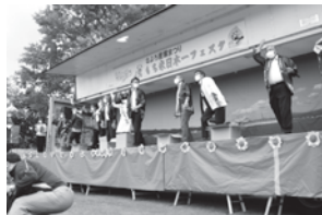
◀ 昨年のもちまきの様子