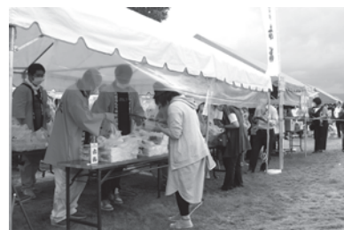
▲昨年の「赤福」販売会の様子

なよろ産業まつりでは、特別に発送していただいた「赤福」の販売会が行われます。この機会にぜひ「赤福」のおいしさを堪能してください。