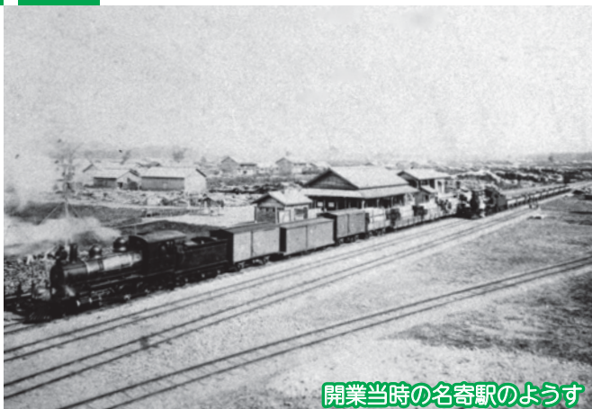
開業当時の名寄駅の様子

その後、路線の編入・分離・改称を行い、1930年（昭和5年）に現在の宗谷本線となりました。