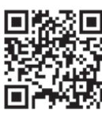
▲天文台ホームページは上のコードから確認できます。