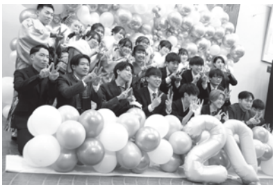
▲令和5年名寄市二十歳を祝う会の様子