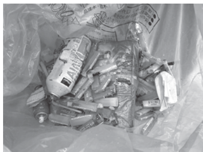
▲ 発火の原因となったごみ

名寄市街地区で収集された埋立ごみの袋の中に「スプレー缶」や「多量のライター」が混在していたことが原因で、収集車両に積み込みを行った際、発火する事故が起きました。