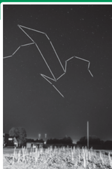
2022年5月20日撮影 【宇宙の写真展2023 展示作品】

3月になると日が沈む頃にはもう春の星座を代表する「しし座」が東の空に昇っています。そして、名寄の名物アスparaを迎える頃、しし座は真夜中には西の空で輝くようになります。写真は昨年の宇宙の写真展で展示された作品で、アスparaの成長期に名寄市内で撮影されました(実際の作品には星座線は書かれていません)。獅子が、美味しそうに育つアスparaを狙っているようです。3月5日から開催される宇宙の写真展2024では、このような名寄で撮影された星空の作品が数多く展示され、名寄の夜空のすばらしさを再発見できます。ぜひ、ご来場ください。