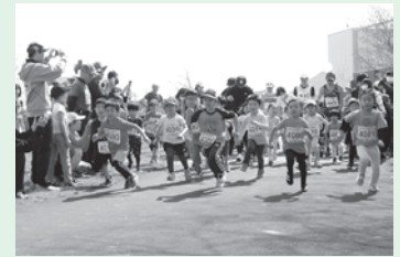
▲昨年の大会の様子