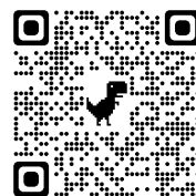
名寄商工会議所HP内 Yoroca特設ページ