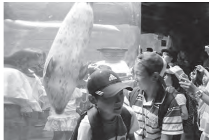
5日目 ・旭山動物園見学とバイオリンリサイタルを鑑賞。