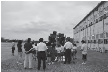
金房小、鳩原小 3～4年生 計21人 ・電子黒板を利用して星の色などの授業。 ・曇天のため遠くの風景を見て望遠鏡の仕組みを勉強。