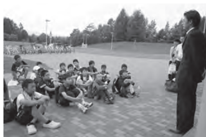
2日目 ・名寄市に到着。開校式では校長の加藤市長からあいさつ。