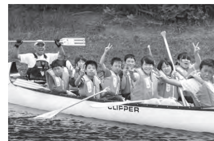
7日目 ・もちつきとカヌーに挑戦。 ・夜はキャンプファイヤー。