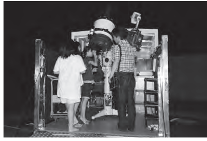
桜井古墳公園駐車場で夜間観望会 ・南相馬ひばりエフエムが観望会を放送時間中に発信。