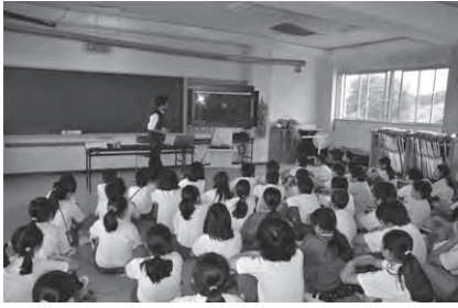
大甕小学校 4～6年生56人 ・電子黒板を使用しての授業。 ・太陽専用の望遠鏡で太陽を観察。