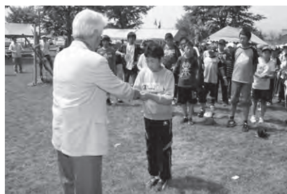
8日目 閉校式 ・へっちゃLANDの解散式と林間学校の閉校式こどもたちに修了証が手渡されました。 ・午後には南相馬市に出発。