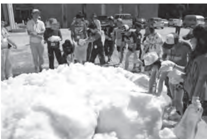
3日目 ・ウォークラリー、雪と親しむ ・北国博物館見学とパン・バター作り体験