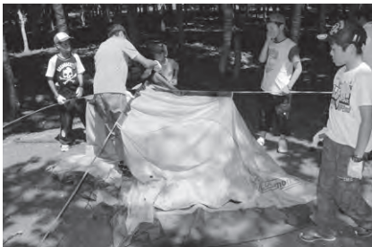
6日目 ・へっちゃLANDに参加。 テントを設営し野外生活体験。