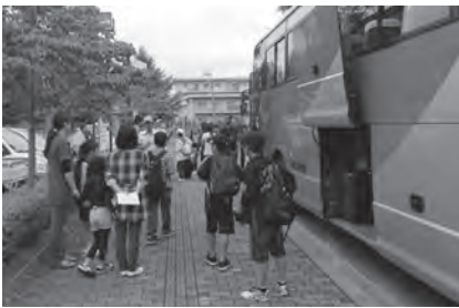
1日目 ・バスに乗車して出発