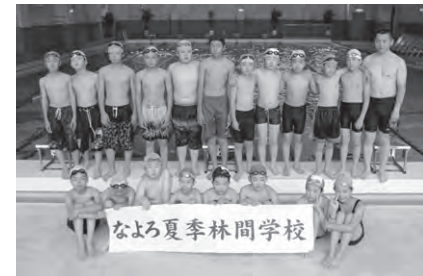
4日目 ・名寄駐屯地とピヤシリシャンツェを見学。駐屯地のプールで水遊び。