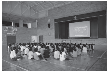
原町第一小学校 5～6年生111人 ・体育館のスクリーンで太陽と月をテーマに学習。 ・太陽専用の望遠鏡で太陽を観察。