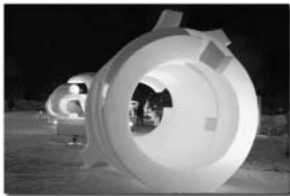
ピンバッジデザイン