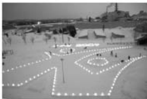
昨年の総合福祉センターでの様子

総合福祉センター会場は本年8回目となります。 昨年から、南地区地域づくり協議会の主催となり、 参加地域が広がりを見せています。