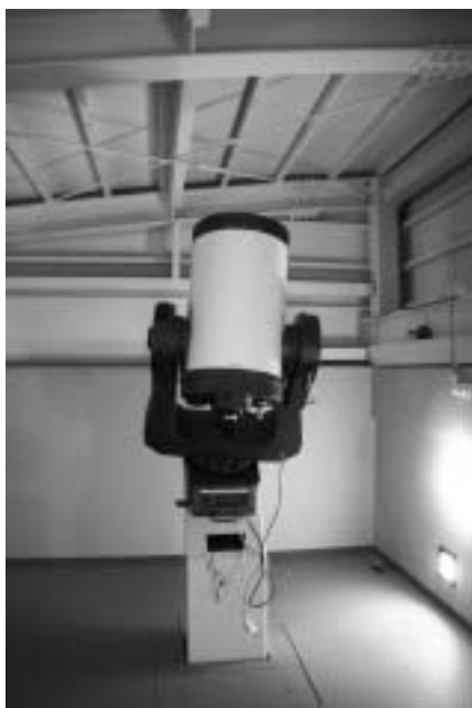
一足早く設置された口径40cmの望遠鏡