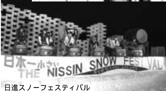
日進スノーフェスティバル