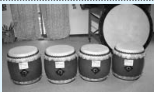
風連御料太鼓保存会で整備した太鼓等