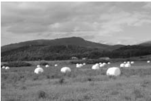
「名寄川から望む九度山」

現在もスキー場や登山道が身近に活用されており、長く受け継がれてきた地域の名勝として守っていききたいものです。