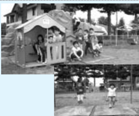
智恵文地域多目的活動協議会で整備した遊具

今回の備品整備により、風連 御料太鼓保存会は各種イベント への積極的参加と、地域内にお ける交流事業の促進、また、智 恵文地域多目的活動協議会は、 新たな遊具をとおして子供から お年寄りまでがふれあう場を提 供してゆくとともに、より一層 コミュニティー活動の発展に寄与 することが期待されます。