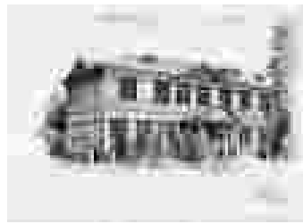
「なつかしの建物水彩画展」から昭和初期の名寄町役場