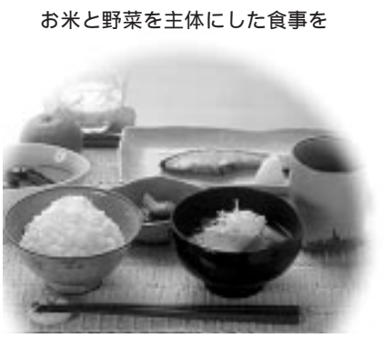
お米と野菜を主体にした食事

朝食の欠食 孤食 食生活の乱れと健康への影響 食・栄養に関する意識 家庭での食育機能低下 地産地消と体験学習・農業体験への取り組みの重要性