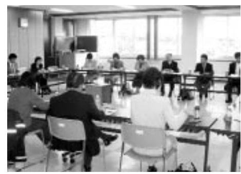
19人の委員が推進計画について検討

また、名寄市は良質で安全な美味しい農畜産物が生産される「食材の宝庫」です。この自然の恵みを最大限に生かしながら、食を通して心身の健康と心豊かな人間性を育めるよう、食育を市民運動として推進いたします。 なお、食育推進を市民運動として進めるため、市民の皆さんに、わかりやすく実践しやすいよう、計画書のダイジェスト版を全戸に配布します。