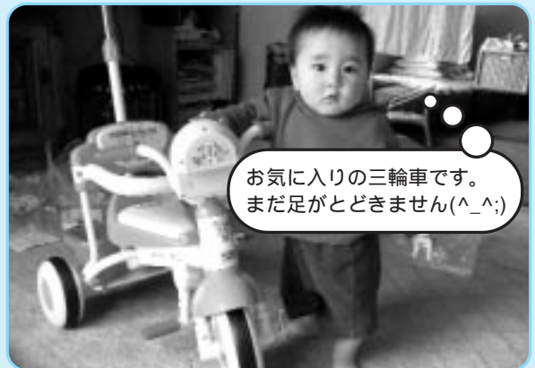
お気に入りの三輪車です。まだ足がとどきません(^_^;)