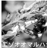
エゾオオマルハナバチ