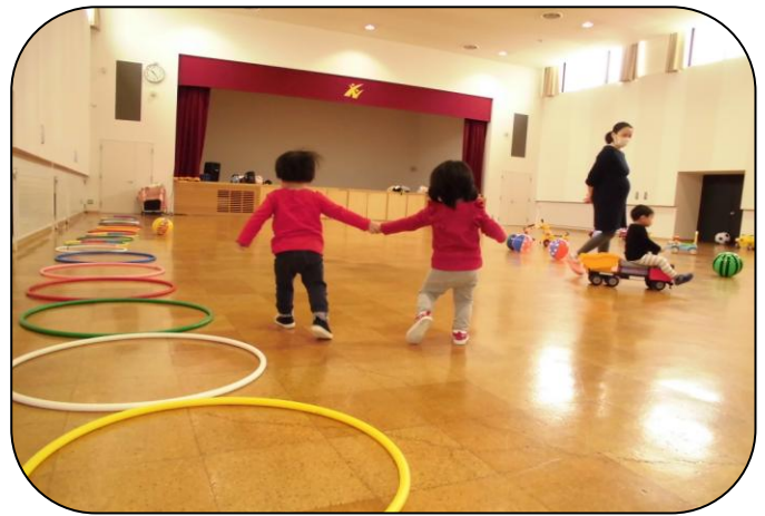
*文化センターの様子*