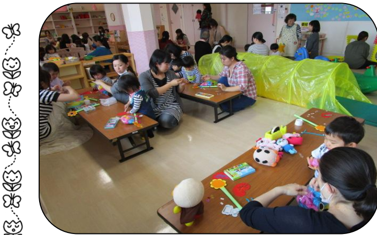
*19・20日「キッズクラフト」*