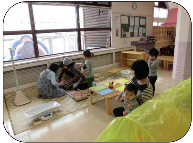
△5月14日・15日「身体測定」▼