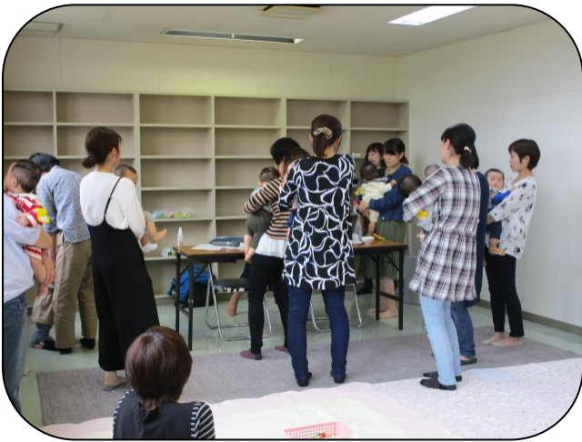
△5月10日「離乳食のお話」▼