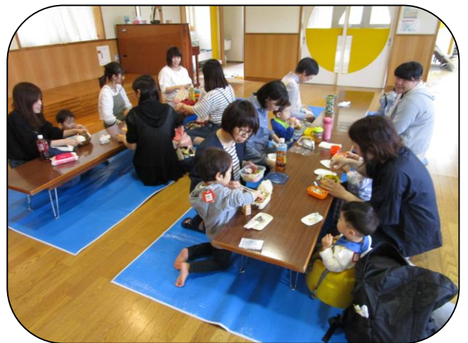
△5月18日「日進バスツアー」▼