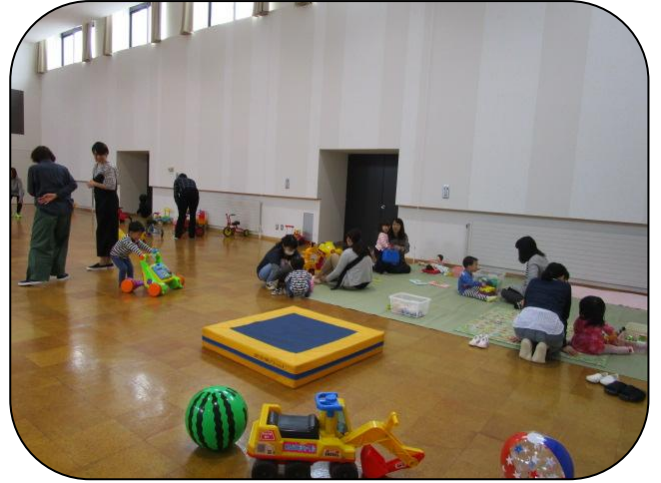
△文化センターの様子▼