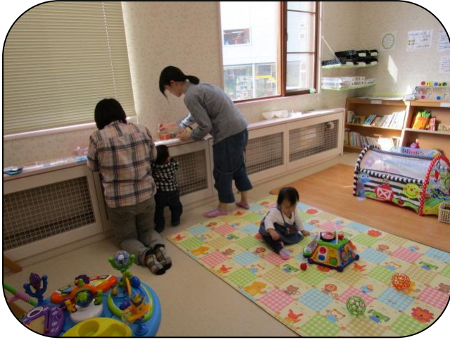
△4月26. 27日「ベビークラフト」▼