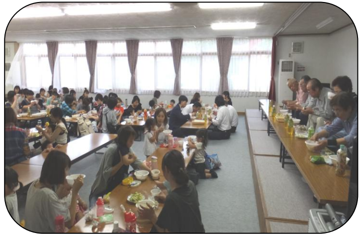
☆9月5日「日進収穫祭」☆ ～野菜を袋に詰めたり、みんなで豚汁を食べました～。