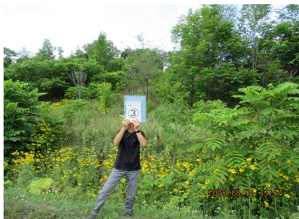
令和7年8月に実施した農地パトロール