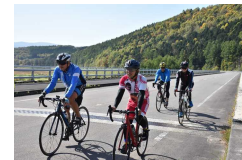
サイクリストの試走