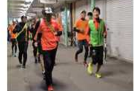
開発を目指すコンテンツイメージ