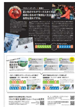
スポーツ移住プロモーションチラシ