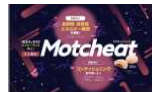
名寄産もち米を使用したスポーツフード「モッチート」

ジュニアオリンピックからの販売を目指して開発を進めてきたが、各種スポーツ大会の中止により現在販売を見送りで中