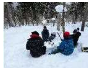
スノーピクニック