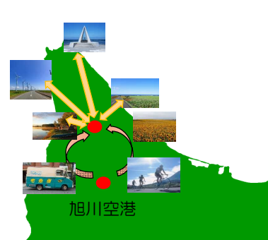
開発商品のイメージ

サイクリストを招聘し、商品化に向けた課題の洗い出し、意見交換を実施。その中で、旭川から名寄までの自転車や荷物の運送の課題、市内宿泊時の自転車の保管、プロモーション不足（＝情報が少なすぎる）の課題が出され、課題を解決した商品を展開するため、運送会社との協議を実施。