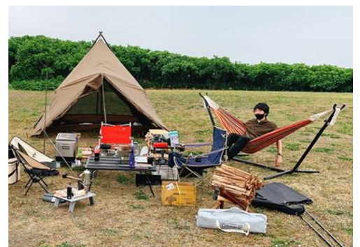
▲休日のキャンプでリラックス中～

他は、バレーや野球やバスケットなど、市役所の部活に所属しており、同僚や先輩などと一緒に汗を流してストレス発散しています。