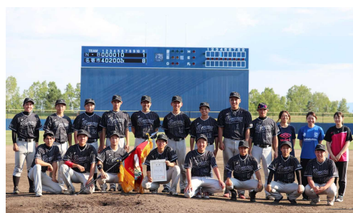
▲市役所野球部で大会出場

最近ではキャンプに行きたいと考えており、コロナが落ち着いたら思いっきり楽しみたいと思っています。