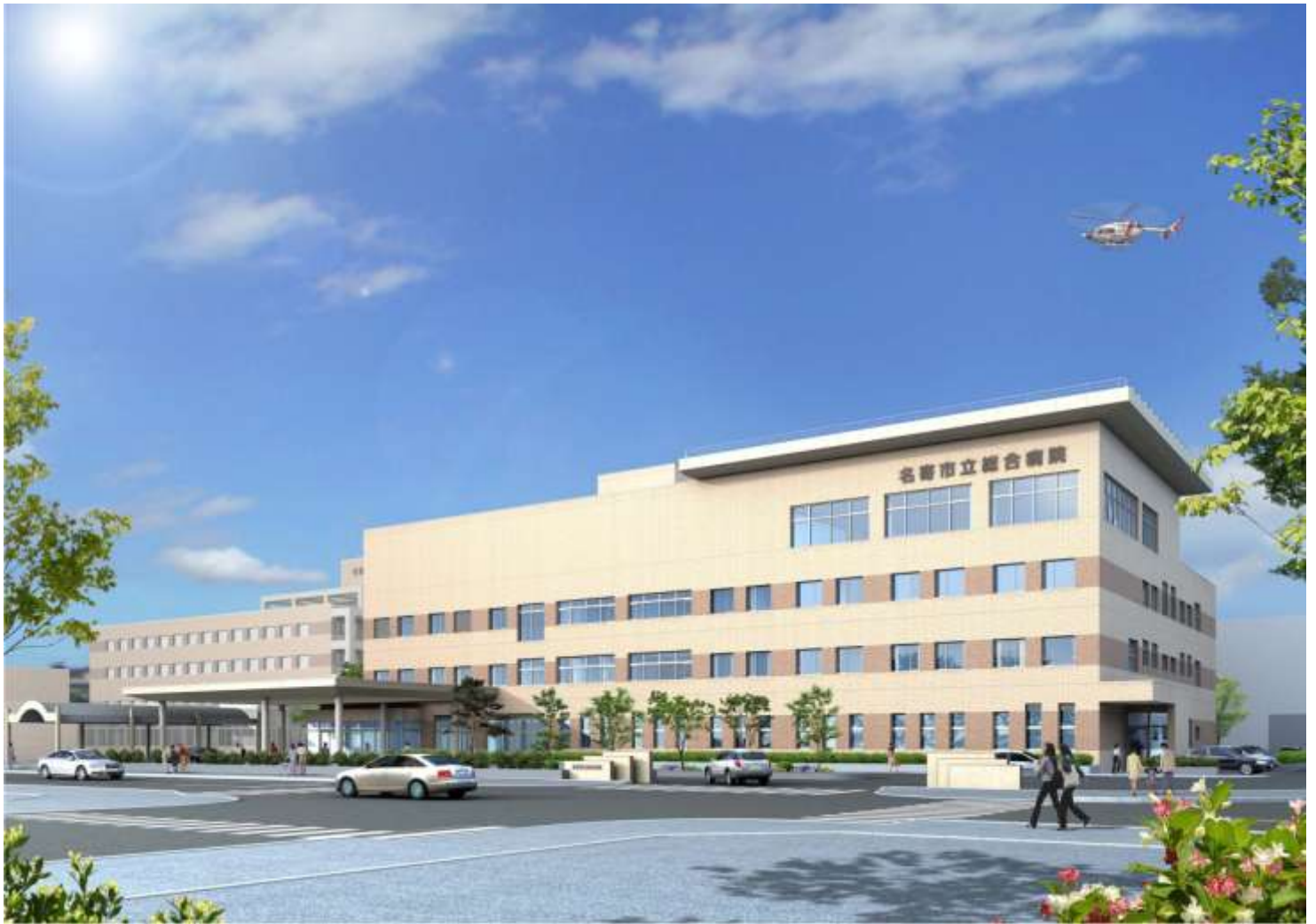
名寄市立総合病院 精神科病棟 完成予想図