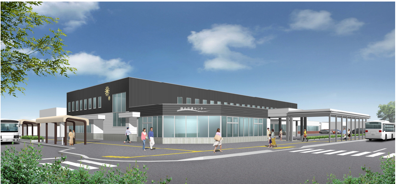
(仮称) 複合交通センター完成予想図