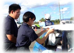
通行された皆さんに、安全運転の呼びかけと、収穫したカボチャをお渡ししました。

9月22日(金)5・6校時に、恵深橋手前の駐車場で交通安全啓発活動を実施しました。地域の方の協力があるからこそできる活動です。警察の方に誘導されて不安を感じていたドライバーも、生徒達のさわやかな挨拶と態度、プレゼントされたカボチャで、笑顔で出発されていました。