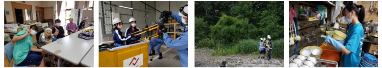
※※※※※※※ 2年生が職場体験学習に出かけました。詳細は裏面をご覧ください※※※※※※※