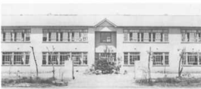
名寄東中学校独立新校舎 昭和29年1月9日（1次完成 名寄市西1条北5丁目）