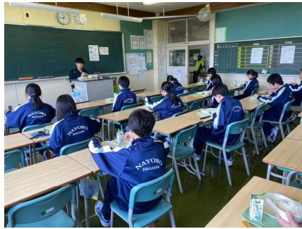
○向かい合わずに食べます。