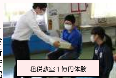
租税教室 1億円体験

未だ、新型コロナウイルス感染症が完全収束する見通しは立ちませんが、感染拡大防止に努めながら、子どもたちの資質・能力の向上に全力を尽くしてまいります。