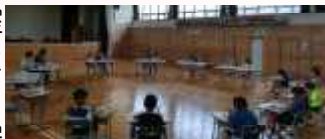
ソーシャルディスタンスに配慮した中名寄小学校との中学年集合学習