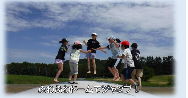
ふわふわドームでジャンプ!

6月22日(火)、1～4年生9名で遠足を実施しました。目的地はサンピラーパーク。名寄大学公園までバスで移動し、そこから約3kmの道のりを歩いて向かいました。当日は、太陽が照りつけるような天候でしたが、子どもたちは全員、元気に活動することができました。