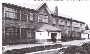
・2階建校舎に改築（工費31,841円）