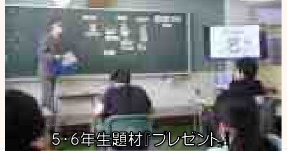
5・6年生題材『プレゼント』