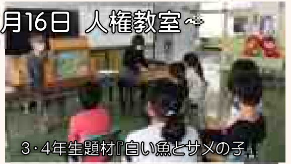
3・4年生題材『白い魚とサメの子』

子どもたちに貴重な機会を提供していただいた名寄市人権擁護委員の皆様へ感謝いたします。ありがとうございました。