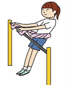
タオルで腰を支えて