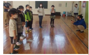
▲FM放送・録音のようす

中秋から晩秋、そして初冬へ。朝夕の寒気と木々の色付きや落ち葉に季節の移り変わりを感じます。学芸会も終わり、学習に全力を傾ける季節の到来でもあります。