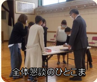
全体懇談のひとつま

参観授業の後は、全体懇談を行いました。全体懇談の中では、保護者の皆様“地域のちょっと危険な箇所”を出し合っただき、毎年更新している安全マップの充実を図りました。学校の教職員だけでは気付かないような場所もあり、大変参考になりました。ありがとうございます。子どもたちの安全な登下校、楽しい屋外での活動のため、今後も「危ない場所」とお気づきの際は、学校までお知らせください。よろしくお願いいたします。