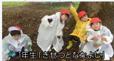
1年生「きせつとなかよし」

実際に「見て」「聞いて」「やってみる」ことは、子どもたちにとって大きな力になります。今後も地域の皆様の力をお借りしなければならない場面がたくさんあると思います。これからもよろしくお願いいたします。