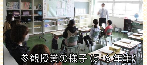
参観授業の様子(5・6年生)

4月13日の参観日、18、19、21日の個人懇談では子どもたちが新担任と楽しく学習する様子や新しくなった教室の配置等を見ていただき、短時間ながら保護者の皆様と子どもたちの学校での様子や頑張っていること等について意見交換することができました。ご協力、ありがとうございました。