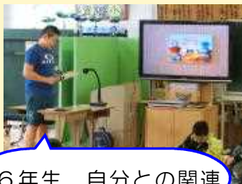
6年生 自分との関連

12月、全学年順番に5回に渡ってブックトーク集会を行いました。国語の学習内容で、学年に応じ、それぞれのめあてに合わせ発表しました。下の学年はこれからの学びの見通し、上の学年は既習の振り返りの時間として、有意義な時間になりました。